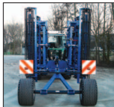
Smal, voor wegtransport